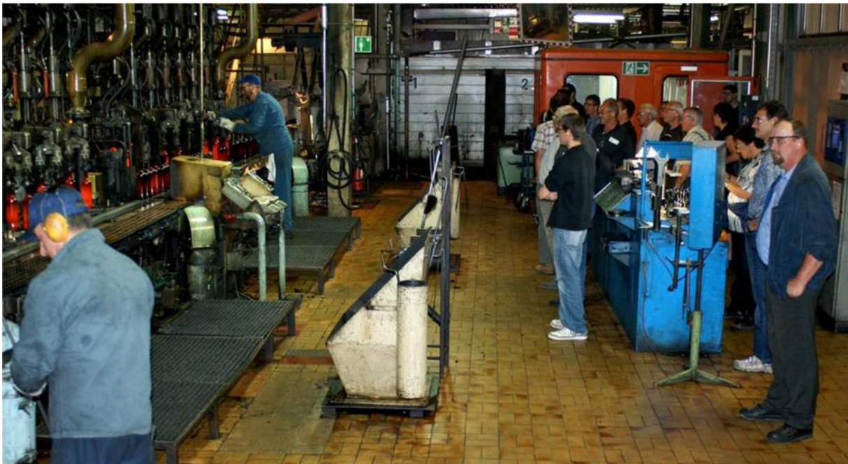
Il personale in visita alla vetreria di St-Prex